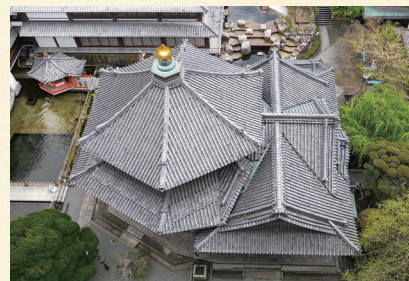
Shiunzan Chohoji-tempel (Rokkakudo)

Het hoofdkwartier van Ikenobo is gevestigd in de Rokkakudo-tempel in Kyoto. Deze tempel werd opgericht door prins Shotoku (574-622). De eerste opperpriester was Ono no Imoko, de officiële gezant die naar de Sui-dynastie van China was gezonden, en sindsdien hebben hoofden van Ikenobo de functie van opperpriester van de Rokkakudo-tempel bekleed. De Rokkakudo-tempel heeft veel bezienswaardigheden, zoals de Navelsteen waarvan gezegd wordt